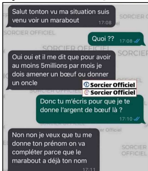
Juste pour rire...